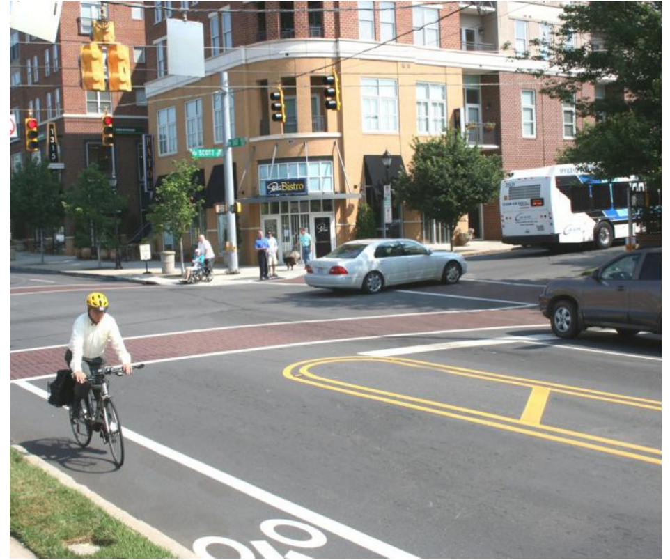
Cruce peatonal de color y árboles de la calle Enhanced crosswalk and street trees