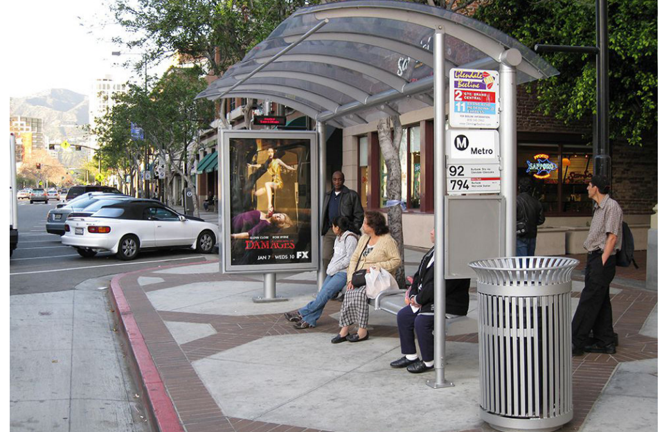
Parada de autobús con extensión de acera Bus shelter with curb extension