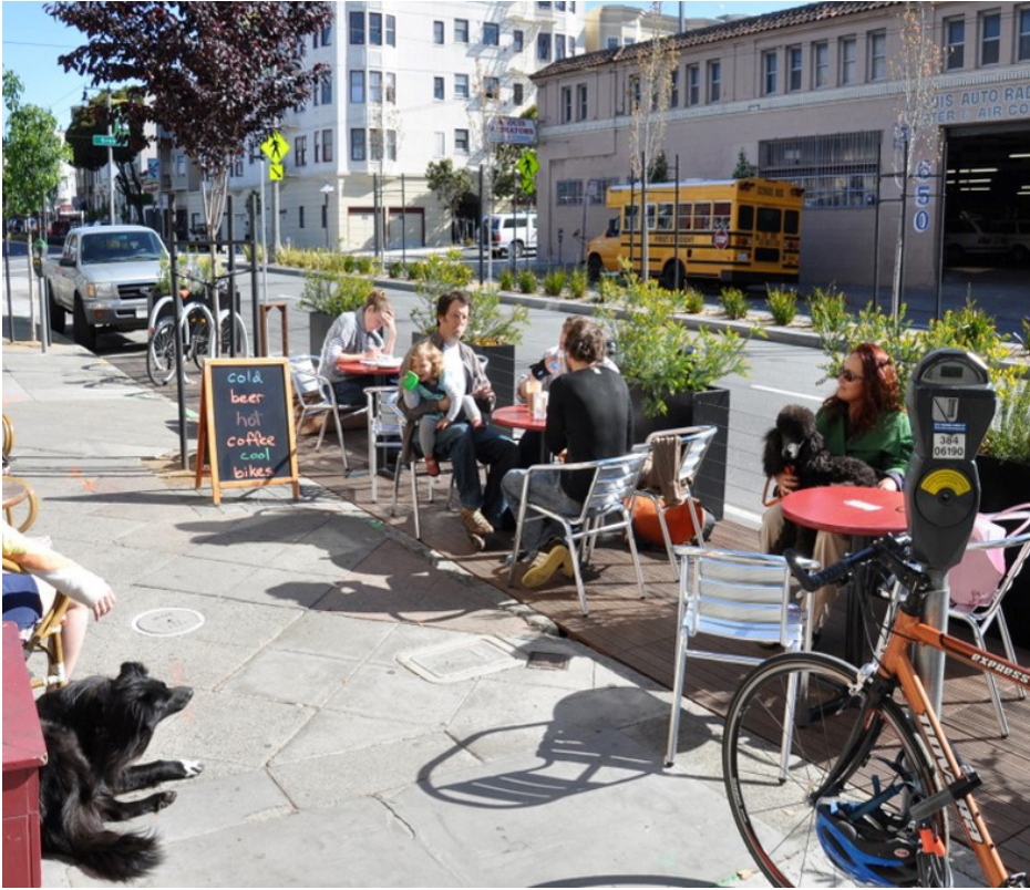
Mini-parque con asientos, mesas y estacionamiento de bici Parklet with seating, tables, and bike racks