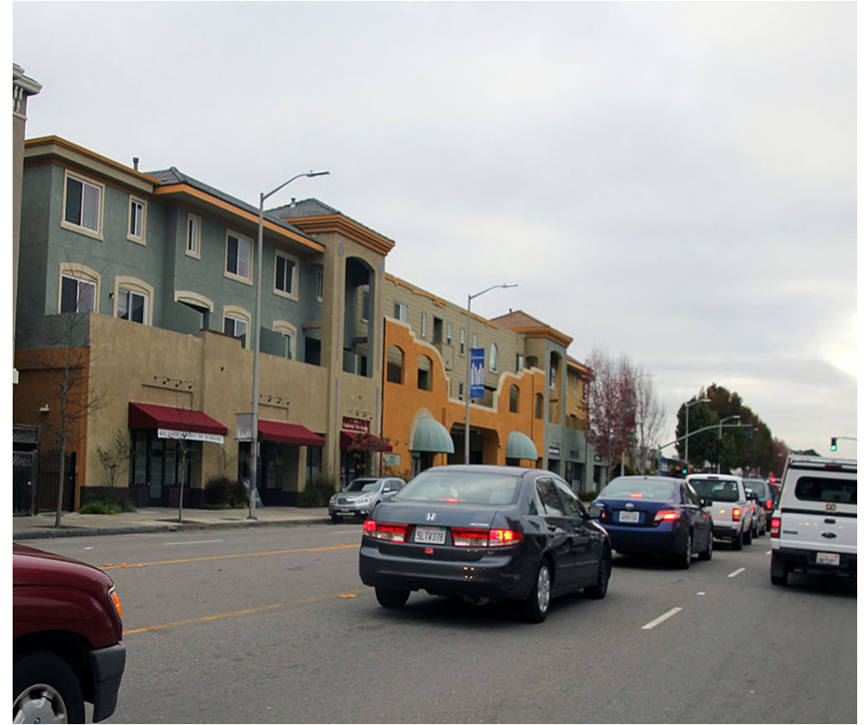
Residencias arriba y detrás de empresas Residences above and behind businesses