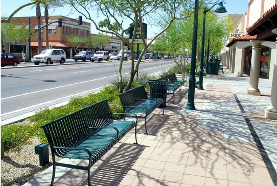
Acera amplia con bancas, jardineras y alumbrado Wide sidewalk with benches, planters, and lighting