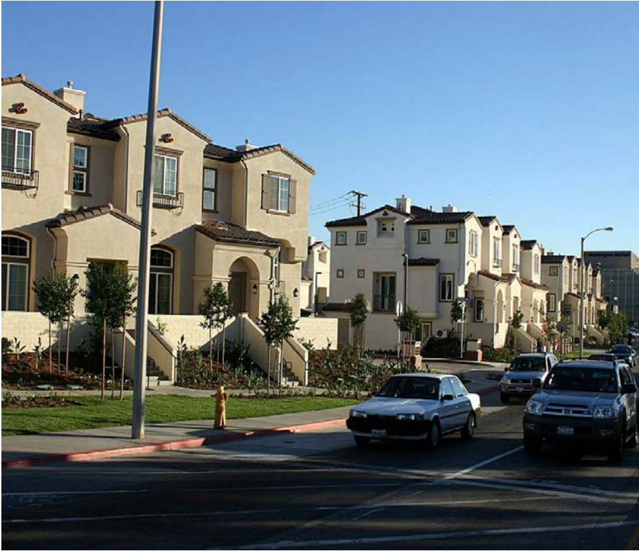
Casas adosadas Townhouses