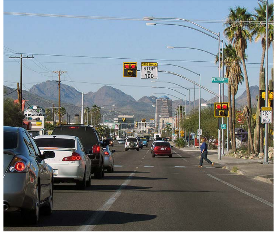
Semáforo de paso de peatones Crosswalk with pedestrian signal