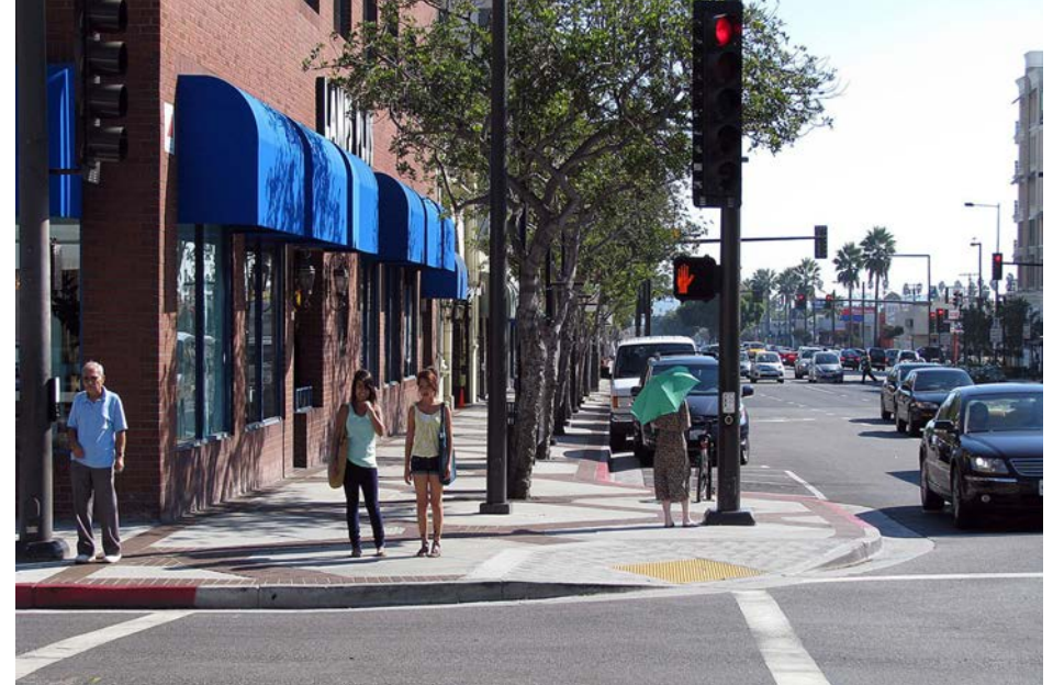
Extensión de acera Crosswalk curb extension (bulb-out)