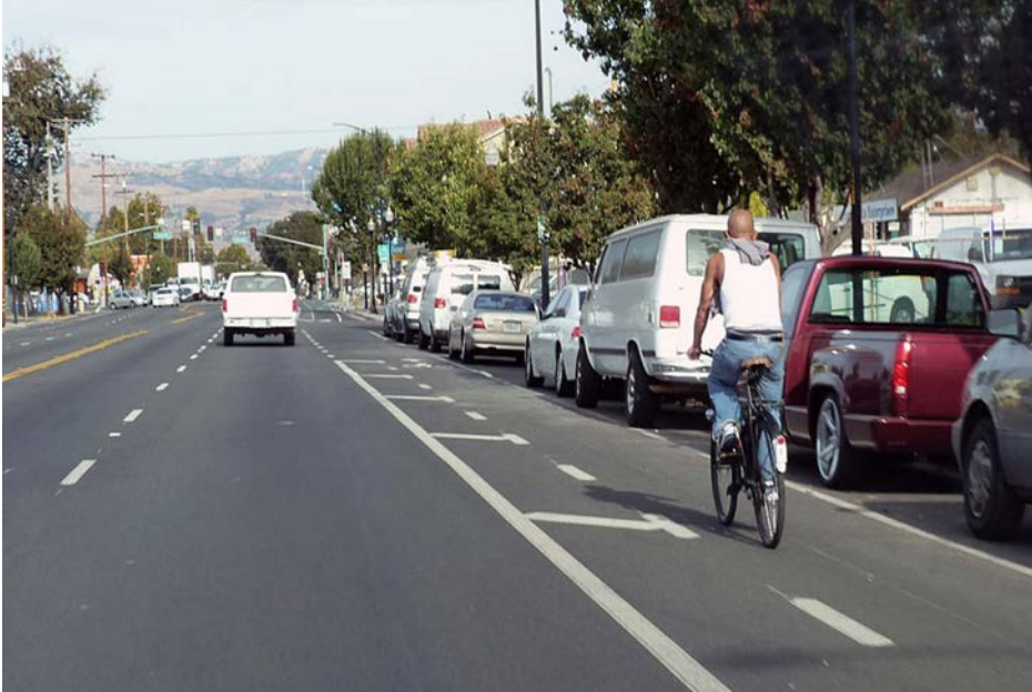
Carril de bicicleta con separación Buffered bike lane