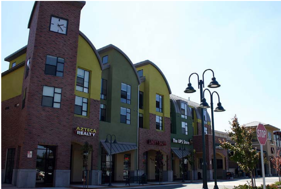
Vivienda arriba de tiendas en Salinas Housing above stores in Salinas