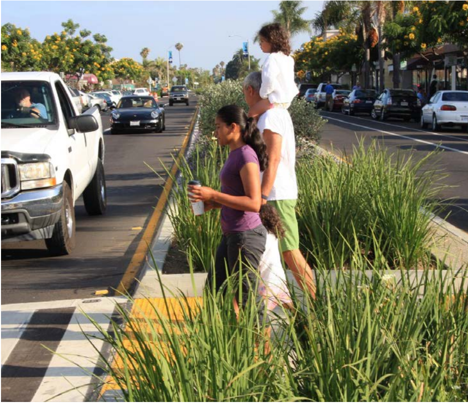
Camellón central con cruce peatonal Median with crosswalk pedestrian island