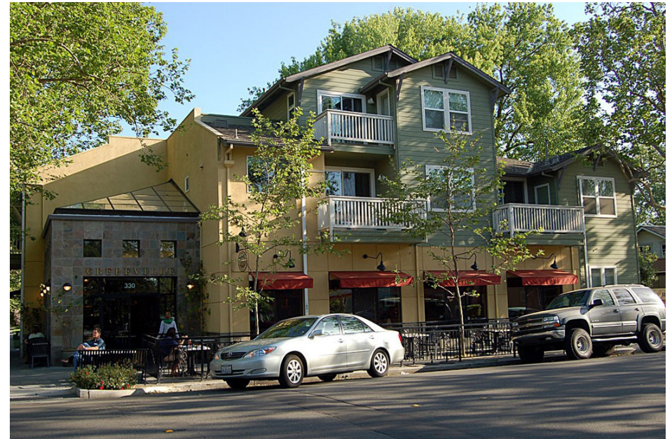
Mezcla de usos a pequeña escala Small-scale mixed use